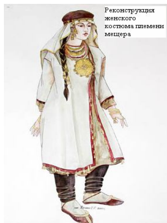
Реконструкция женского костюма племени мещера

Территория окрестностей современного Бельского заселена очень давно. В районе Брыкина бора и Лакаша обнаружены поселения возрастом 6000 – 4000 тысяч лет назад 17 . Не далеко от Деулино раскопано финно-угорское поселение возрастом 2000-1500 тысячи лет назад. В окрестностях села Бельское никто никогда раскопок не проводил, и, в общем, историей села не занимался. А если покопать? Кто знает, что таят бельские бугры в своем песчаном «брюхе»?