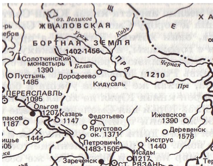
Рис. 1. Территория современного Спасского района в 15-16 веках (цифры на карте – год первого упоминания в летописи) (из книги Цепкова, 1995)

В XIV-XV веках междуречье Пры и Белой известно как Жваловская бортная земля . На картах начала 15 века уже отмечено Дорофеево, Кидусаль и река Белая (рис. 1).